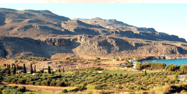
Η κοιλάδα της Κάτω Ζάκρου. Διακρίνεται η θέση του αρχαιολογικού χώρου σε σχέση με τη σημερινή αστυρισμική

Η έρευνα στη θέση διακόπηκε το 1990, αφού έφερε στο φως εκτός από το σύνολο του ανακτορικού συγκροτήματος, περί τα τριάντα πέντε κτήρια του μινωικού οικισμού, καθώς και πολυάριθμες ταφές ποικίλων χρονολογικών περιόδων, διάσπαρτες σε διάφορα σημεία της περιβάλλουσας ζώνης. Την απόφαση της προσωρινής αναστολής των εργασιών καθόρισαν η ανέκδοτη ολοκλήρωση της συντήρησης και επιστημονικής δημοσίευσης των ευρημάτων, τον οποίων η ποσότητα, αλλά και η ποιότητα, ξεπερνούν τις αντίστοιχες των άλλων προϊστορικών θέσεων της Κρήτης. Αρκεί μόνο να αναφερθεί ότι τα μέχρι σήμερα αποκατεστημένα πηλίνα αγγεία ξεπερνούν σε αριθμό τις τρεις χιλιάδες, ενώ οι υπό καταγραφή σχετιζόμενες με αυτά κεραμεικούς ομάδες καταλαμβάνουν περισσότερα από χίλια κιβώτια συσκευασίας αρχαιολογικών ευρημάτων.