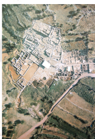
Αεροφωτογραφία του αρχαιολογικού χώρου με μπρούτζινα

Η ασφάλεια που παρέχει στα πλοία το κλειστό απανωτό λιμάνι και η στρατηγική της θέση - σχεδόν πάνω στο θαλάσσιο πέραςμα μεταξύ Κρήτης και Κάσου - οδήγησαν την προϊστορική Ζάκρο σε άνθηση, το επιστέγασμα της οποίας υπήρξε η ίδρυση του ανακτορικού κέντρου. Τα κινεζαϊκά προέλευσης πολιτισμικά στοιχεία που μπορεί να ιχνηλατήσει κανείς, τόσο στην αρχιτεκτονική όσο και στα κινητά ευρήματα του, οδηγούν στη σκέψη πως το ανάκτορο οικοδομήθηκε πιθανότατα για να εξυπηρετήσει τα συμφέροντα της Κνωσού, που την περίοδο αυτή - γύρω στο δέκατο έκτο αιώνα π.Χ. - φαίνεται να επεκτείνει την κυριαρχία της πάνω στο νησί.