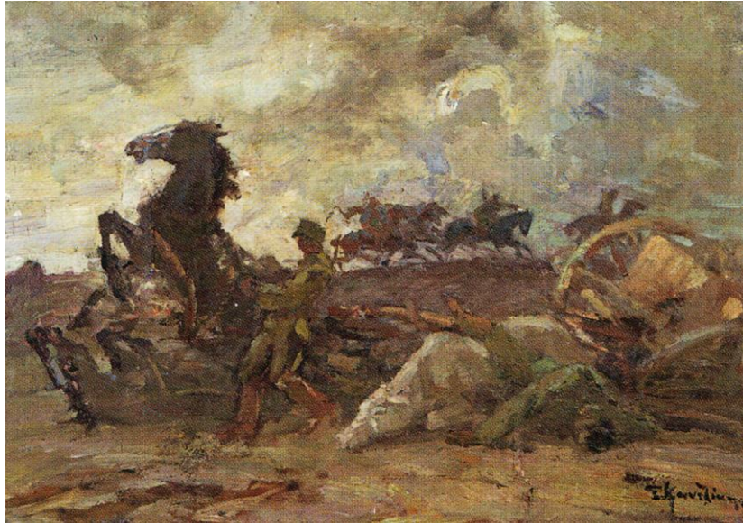
Σταύρου Καντζίκη, Πολεμική σκηνή , ελαιογραφία σε μουσαμά, 46,5 × 63,5 εκ., Δημοτική Πινακοθήκη Ιωαννίνων