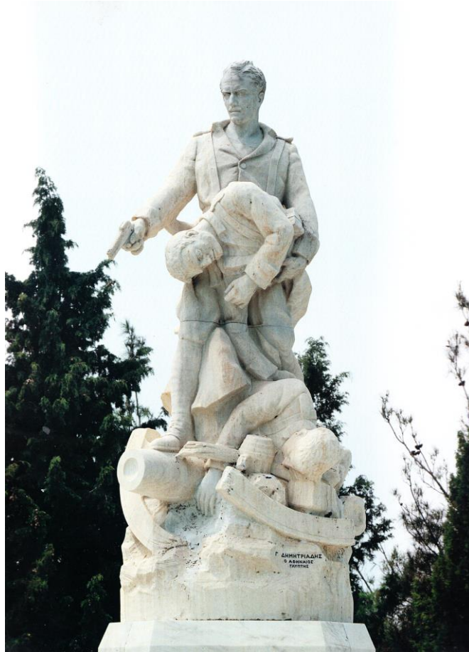
Γεωργίου Δημητριάδη του Αθηναίου, Ηρώο Κιλκίς , 1928, μά- μαρο, ύψ. 290 εκ