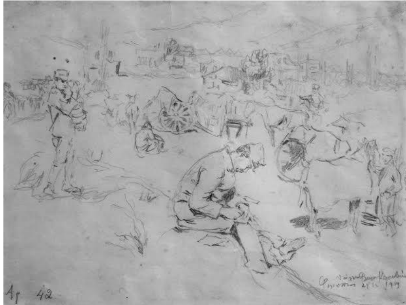
Θάλειας Φλωρά-Καραβία, Καταυλισμός εις Φιλιπιάδα , 1913, μολύβι, 24,5 × 32,5 εκ., Δημοτική Πινακοθήκη Ιωαννίνων