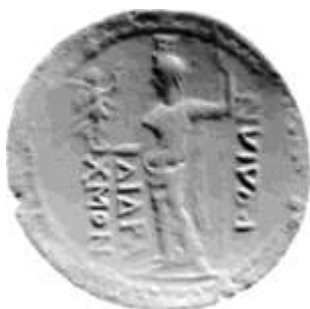
Εικ 17 : (RPC III 2181) Χαλκό δίδραχμο επί Νέρβα