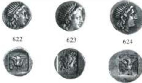
Εικ. 4: Πλινθοφόροι δραχμές