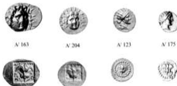
Εικ. 7: Χρυσός στατήρας (163), ημιστάτηρο (204) τέταρτο στατήρα (123, 174)