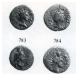
Εικ. 21 : ροδιακά χαλκά : ΡΟΔΙΩΝ, προτομή Ηλίου/ ΡΟΔΙΩΝ, προτομή Σαράπιδος