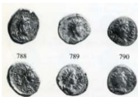
Εικ. 23 : ροδιακά χαλκά επί Κομμόδου