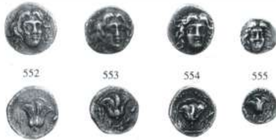
Εικ. 3: Δραχμές (552-553-554), ημίδραχμο (555)