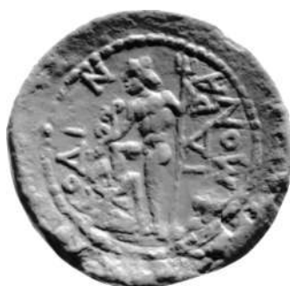
Εικ 19 : (RPC III 2184). Χαλκό δίδραχμο επί Τραϊανού