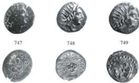
Εικ. 11: χαλκοί οβολοί