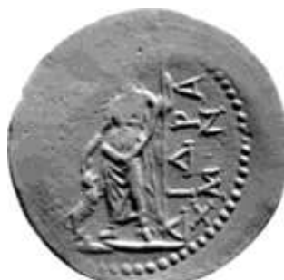
Εικ 18 : (RPC III 2183) Χαλκό δίδραχμο επί Τραϊανού