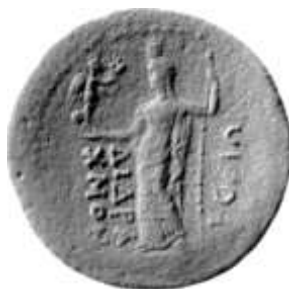
Εικ 16 : (RPC III 2180) Χαλκό δίδραχμο επί Νέρβα