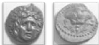
Εικ. 8 : αργυρό δίδραχμο περιόδου πλινθοφορικής ομάδας D