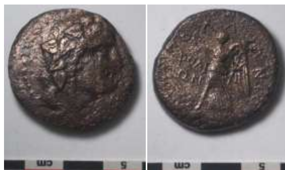
Εικ. 14: χαλκό δίδραχμο (ΕΦΑΔΩΔ Ν2228)