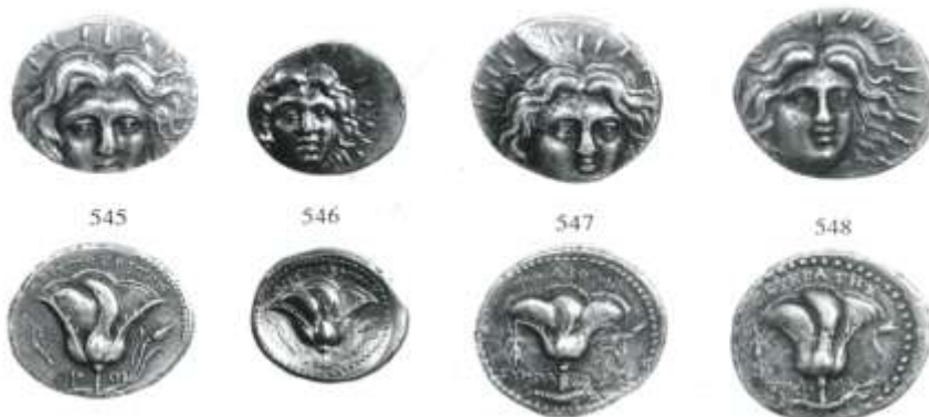
Εικ. 1: Ροδιακά ετράδραγμα (545, 547-548), δίδραγμα (546)