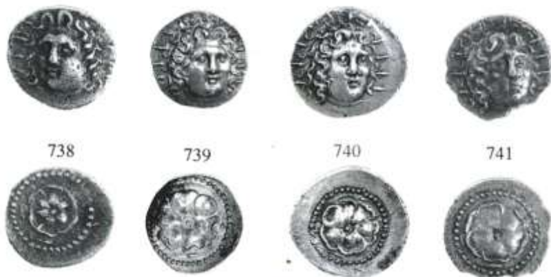
Εικ. 9 : Αργυρά δίδραχμα