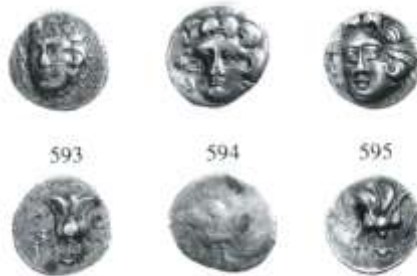
Εικ. 5: Ψευδο-ροδιακές δραχμές, κοπές Κρητης