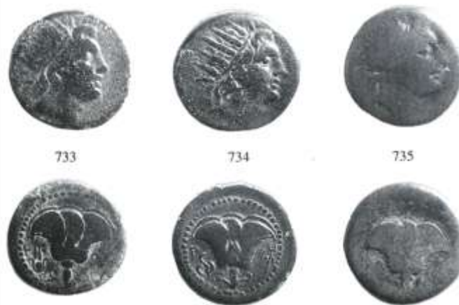
Εικ. 12: χαλκές δραχμές