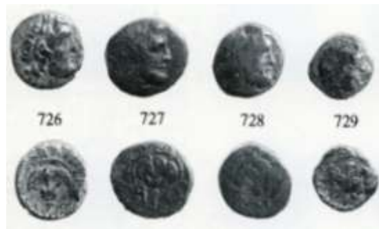
Εικ. 13: τετράχαλκα ;