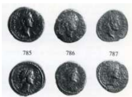
Εικ. 22 : ροδιακά χαλκά επί Αντωνίνου Ευσεβούς