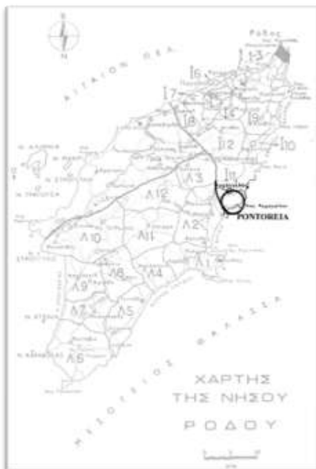
Χάρτης 2 : Περιοχή Ποντώρεια (αρχαίος δήμος Ποντωρέων)