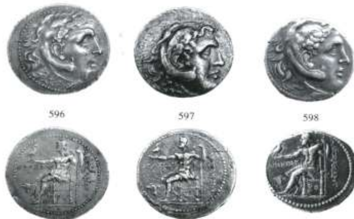
Εικ. 2: Τετράδραγμα με τύπους Αλεξάνδρου (διεθνείς)