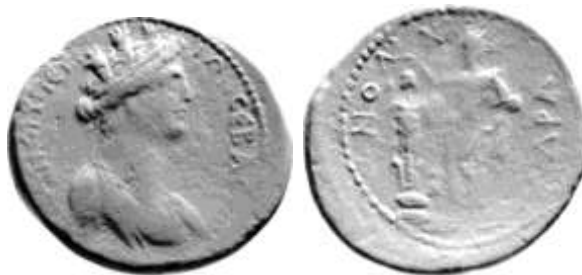
Εικ. 20 (RPC III, 2185). Χαλκό δίδραχμο, τέλη 1 ου -αρχές 2 ου αι μ.Χ.