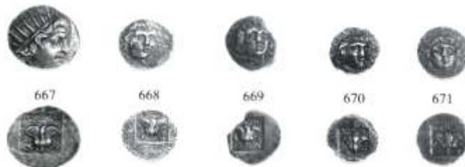
Εικ. 6: Ομάδα D: δραχμή (667), ημίδραχμα (668-671)