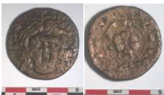
Εικ. 10 : (ΕΦΑΔΩΔ Ν2922) : Τετράδραχμο (;)