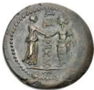
Εικ 15 : (RPC III 2177), Χαλκό δίδραχμο επί Νέρβα